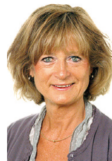
AM Alströmer kommunutvecklare

sommaren hoppas medlemmar i föreningen på lika många passage-rare. Nästa år fyller ångbåtstrafiken 20 år. Även det ökande antalet arrangemang lockar allt fler besökare hit. Uppskattade evenemang är Nossebro Marknad, som äger rum nu på onsdag och Power Meet på lördag!