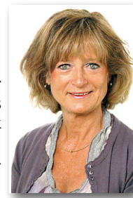
AM Alströmer kommunutvecklare

Missa inte föredraget 26 november om turism och dagen efter, 27 november, är det dags igen för Nossebro Marknad. Väl mött!