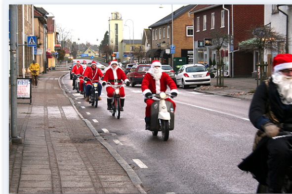
Missa inte årets mopedkortege med tema tomtar på hjul i Nossebro den 14 december.

Vi kommer att genomföra en "Leva- och Bomässa" 5-6 april 2014. Inbjudan kommer, notera datum!