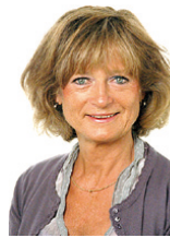
AM Alströmer kommunutvecklare

Kommunen kommer även i år att vara representerad på Turistmässan i Göteborg 20-23 mars genom bl a retroprojektet. Väl mött då och även nu på onsdag i samband med Nossebro Marknad.