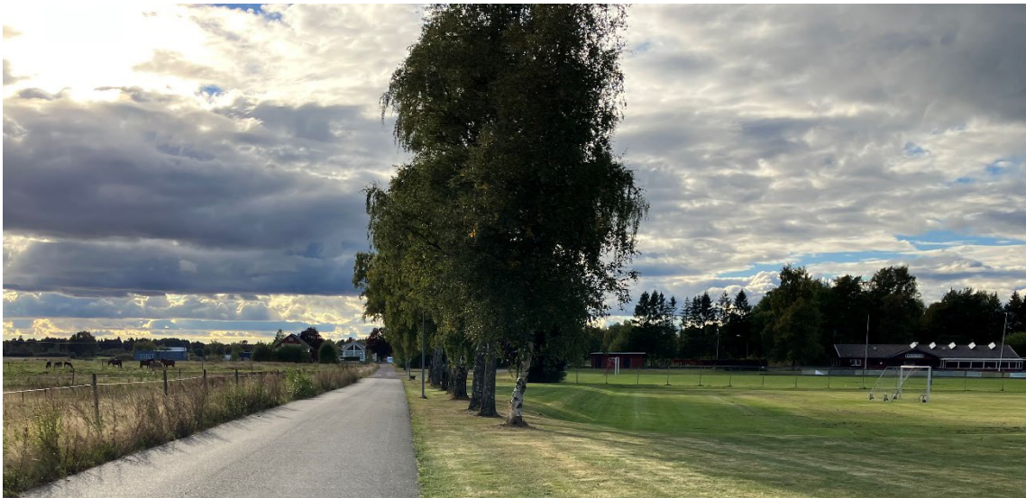
Bild 7: Trädrad längs väg in till Lunnabacken

Alla åtgärder som kan skada en allé kräver dispens. Exempel på sådana åtgärder är avverkning av levande eller döda alléträd (inklusive högstubbar), skapande av nya högstubbar eller arbeten som kan skada trädens rötter. Rötterna skyddas genom att avgränsa ett område runt trädet som är minst 2 meter utanför kronans ytterkant, men helst 15 gånger stammens diameter. Inom området ska det inte ske någon grävning, körning med tunga maskiner eller upplägg av massor.