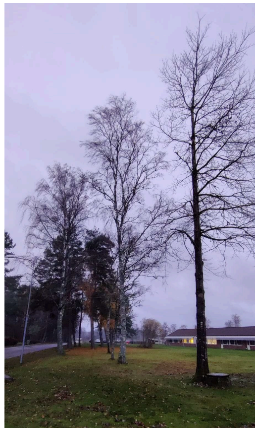
Bild 5: Träd längs Ekvägen sett söder ifrån respektive norr ifrån.